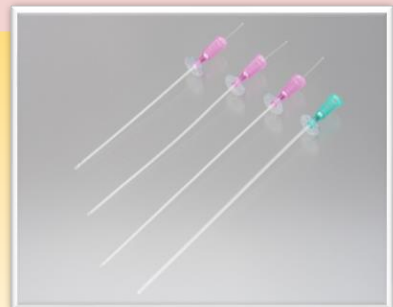
12種類のラインナップ(サイズ構成参照)