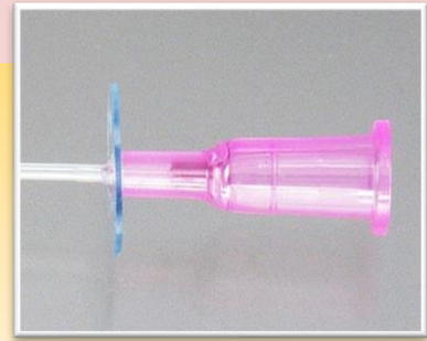
薄くてやわらかい固定板