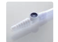
クリニー採尿バッグ(ローフロアー)