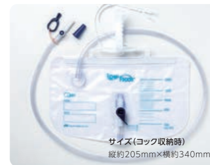
サイズ(コック収納時) 縦約205mm×横約340mm