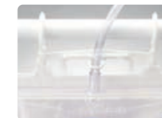
平行に吊り下げ可能な脱 着フック