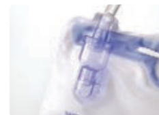
逆流しにくい層式ドリッ プチャンバー