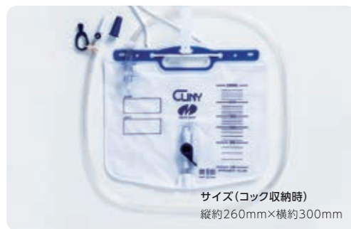
サイズ(コック収納時) 縦約260mm×横約300mm