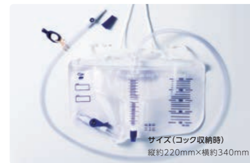
サイズ(コック収納時) 縦約220mm×横約340mm