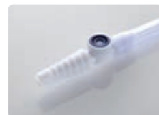
針が不要なニードルレス サンプルポート