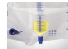
50mL以下は1mL刻みで 表示