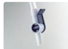
片手で容易に排尿可能な コックハンドル