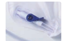
片手で容易に排尿可能な コックハンドル