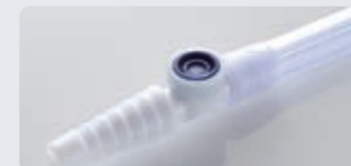
針が不要なニードルレスサンプルポート