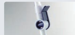
片手で容易に排尿可能なコックハンドル